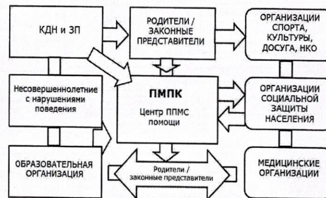
Организационная схема взаимодействия ПМПК с другими организациями на докриминогенном этапе Схема 1

На Схеме 1 представлены разные траектории направления ребенка на ПМПК и взаимодействия комиссии с различными структурами. Например, на ПМПК может направить Комиссия по делам несовершеннолетних и защите их прав (далее – КДН и ЗП), образовательная организация, реабилитационный центр.