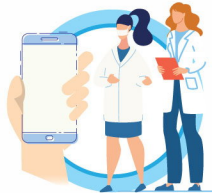
В СЛУЧАЕ ЗАБОЛЕВАНИЯ ОБРАЩАЙТЕСЬ К ВРАЧУ