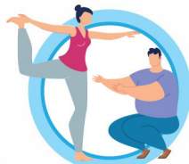
ВЕДИТЕ ЗДОРОВЫЙ ОБРАЗ ЖИЗНИ