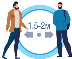
СБЛЮДАЙТЕ РАССТОЯНИЕ И ЭТИКЕТ