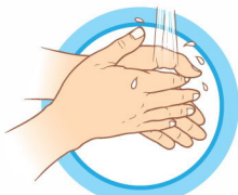
ЧАСТО МОЙТЕ РУКИ С МЫЛОМ